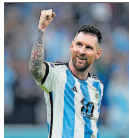
Messi, tras el tercer gol argentino.

De la Fuente: “Hay futbolistas para jugar al contragolpe” P36 A 44