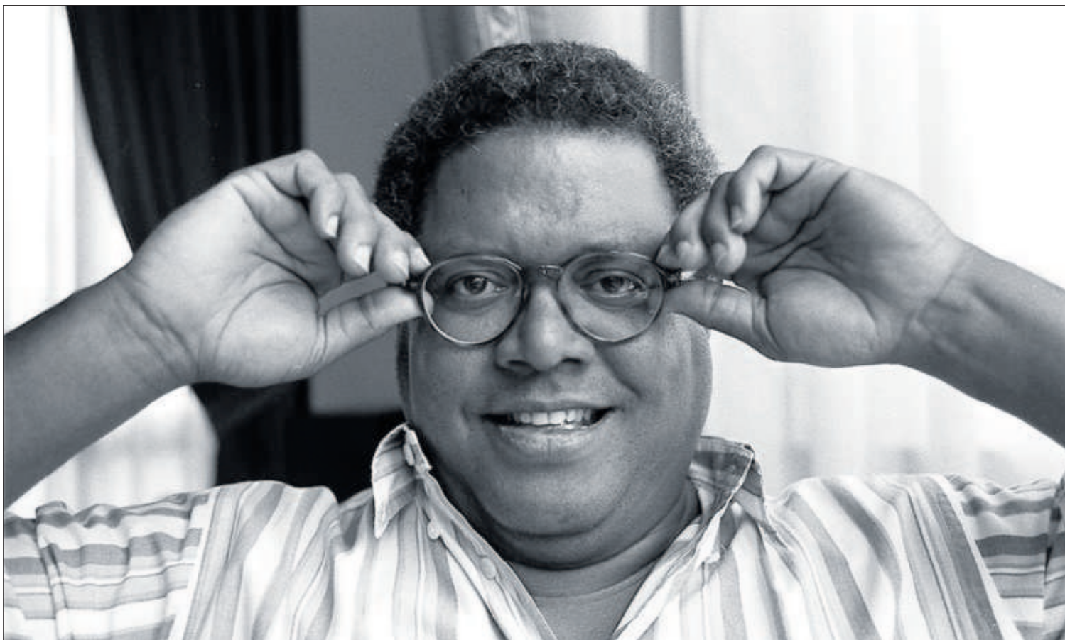
PABLO MILANÉS, FIGURA DE LA CANCIÓN CUBANA Y UNIVERSAL. El autor de temas inmortales como Yolanda o La vida no vale nada falleció ayer a los 79 años en Madrid, donde se trataba de un cáncer. Milanés, en la imagen en Madrid en 1994, fue pilar del movimiento de la Nueva Trova Cubana, en el que no quería ser encasillado, y sirvió de puente entre generaciones y estilos. PÁGINAS 28 A 30