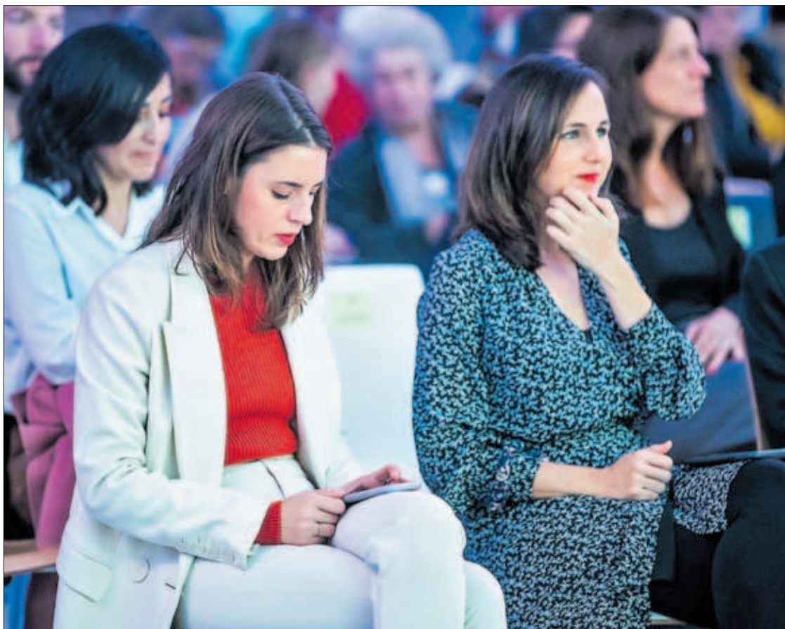
Irene Montero e Ione Belarra, ayer en un acto por el Día de los Derechos de los Niños.

THOMAS HITZLSPERGER Exfutbolista alemán "No hay muchos valientes para salir del armario"