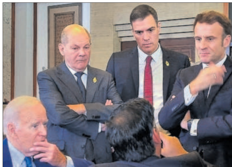
Joe Biden, Olaf Scholz, Pedro Sánchez, Emmanuel Macron y Rishi Sunak, ayer en una reunión de emergencia en Bali