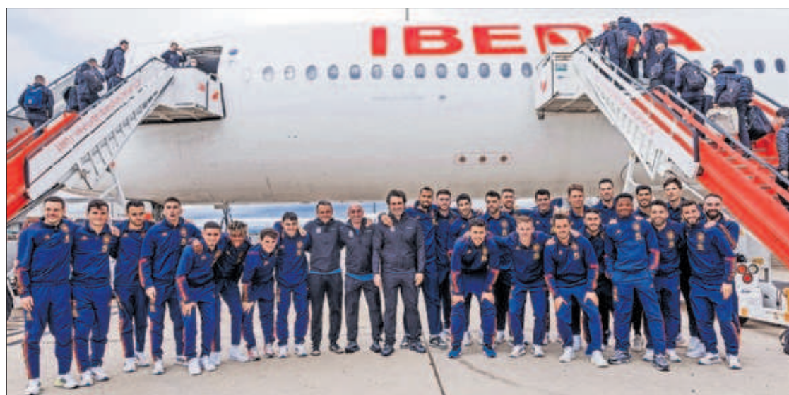
La selección, ayer antes de volar con destino a Jordania, donde jugará un amistoso mañana.

"A los uruguayos nos enseñan a competir descalzos o con piedras" P38