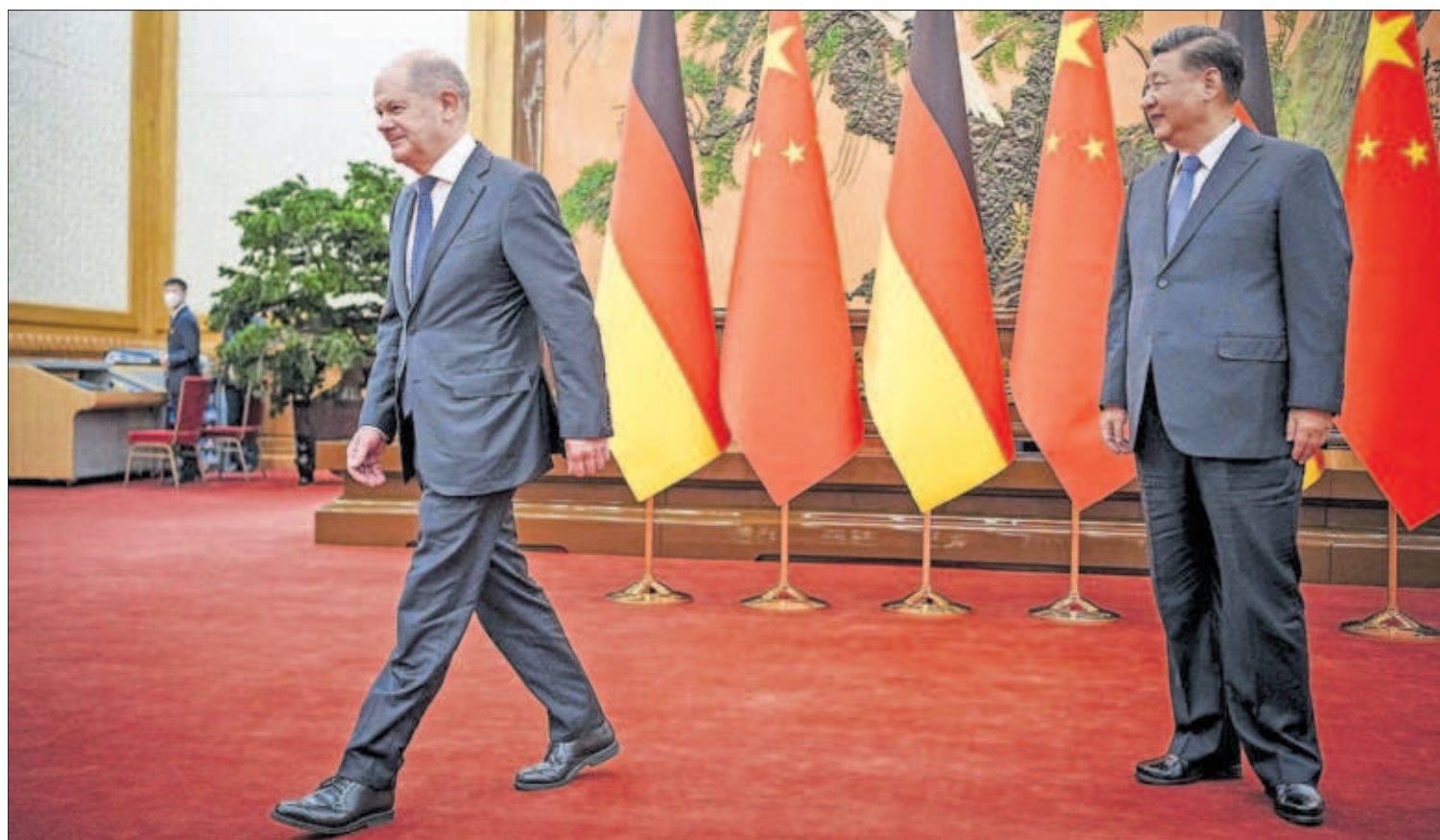
ALEMANIA Y CHINA, CONTRA LA AMENAZA ATÓMICA. El canciller alemán, Olaf Scholz, y el presidente chino, Xi Jinping, evidenciaron ayer su posición común frente a la intimidación más feroz de Rusia. “El presidente Xi y yo hemos estado de acuerdo: las amenazas nucleares son irresponsables e incendiarias”, dijo Scholz tras el primer cara a cara de un líder europeo con el asiático desde la crisis pandémica. P4