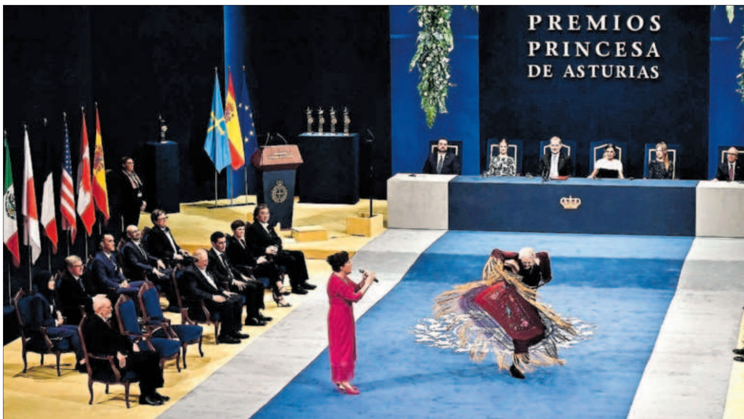
EL BAILE DE LOS PRINCESA DE ASTURIAS. El canto de Carmen Linares y el baile de María Pagés constituyeron uno de los momentos más emotivos de la ceremonia de entrega de los premios Princesa de Asturias ayer en Oviedo, en presencia de la Familia Real. Felipe VI centró su discurso en la defensa del proyecto político europeo y el lamento por el "horror" de la guerra en Ucrania. PÁGINA 30

El hombre más rico del mundo paga 44.000 millones por la red social