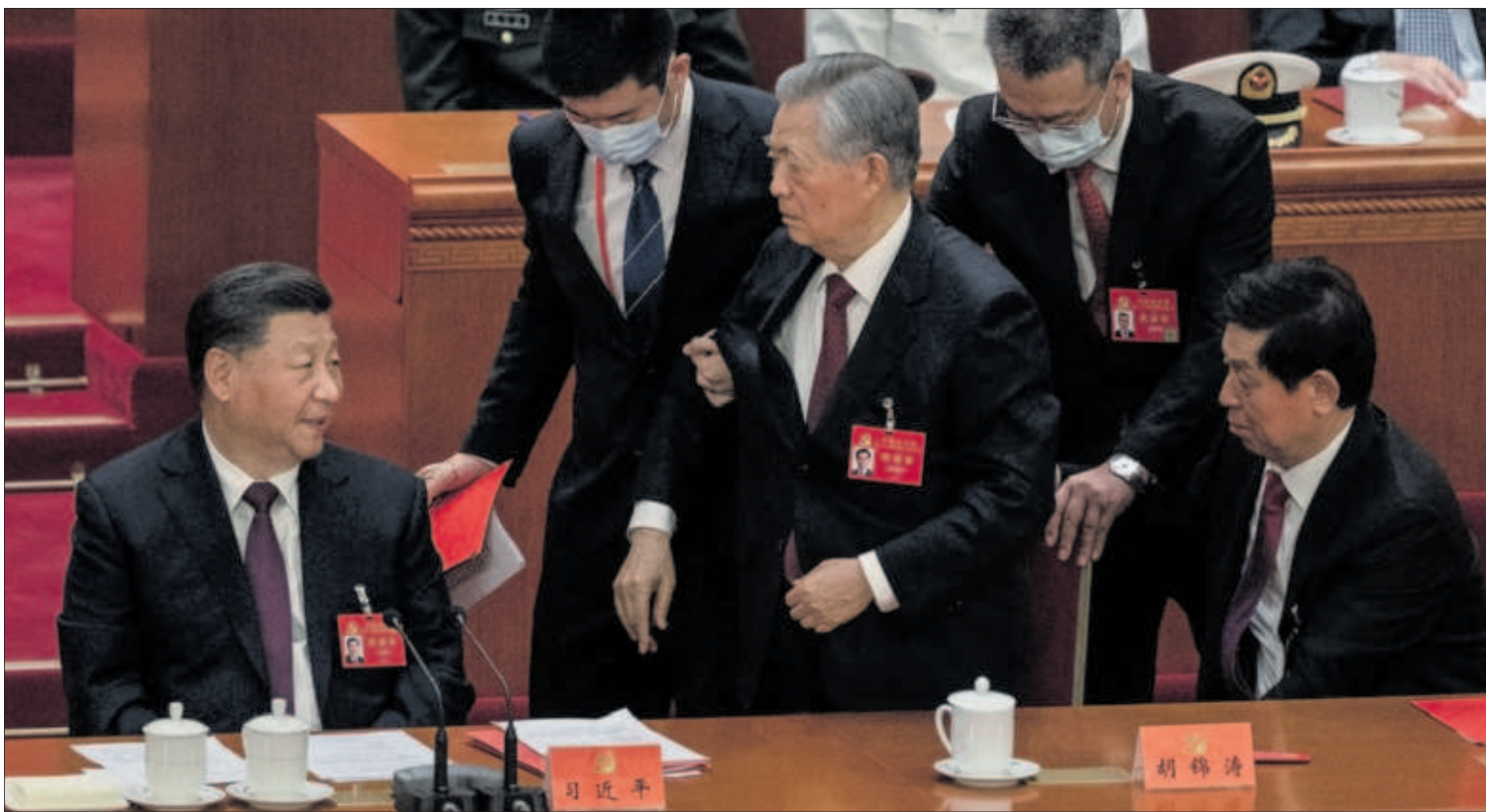
EL INSÓLITO DESALOJO DE UN EXPRESIDENTE. Hu Jintao, de 79 años, fue obligado ayer a abandonar el 20º Congreso del Partido Comunista Chino en Pekín, del que su sucesor, Xi Jinping, saldrá hoy reforzado. La agencia oficial Xinhua atribuyó la escena, silenciada en internet y que otras fuentes interpretan como una purga, a una indisposición. En la imagen, Hu mira a Xi al ser expulsado de la sala. PÁGINAS 12 Y 13

menos, están abonados a la ingeniería financiera. Microcréditos, cambios de hipotecas, tarjetas revolving. “Con el subidón de precios no llegamos”, dice una mujer en paro con dos hijos. PÁGINAS 52 A 55