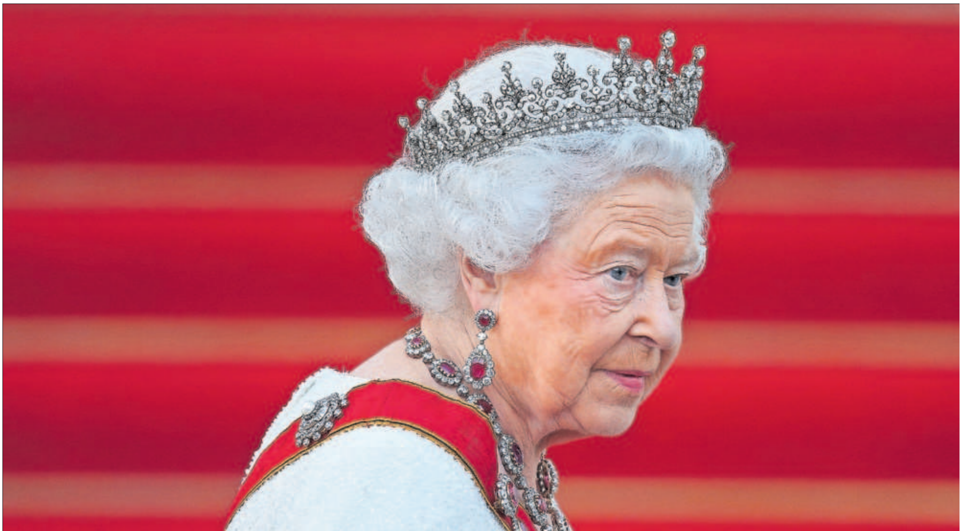
Isabel II de Inglaterra, en junio de 2015 a su llegada a un banquete en su honor en el palacio de Bellevue (Alemania).