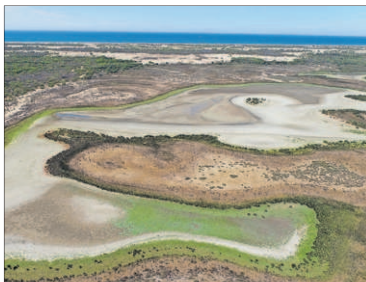
La laguna de Santa Olalla, ayer, en una imagen de la Estación Biológica.