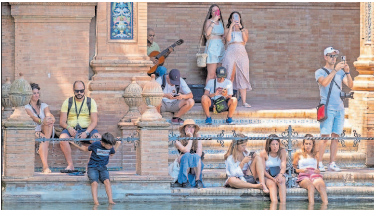
Varias personas se refrescaban ayer, cobijadas del sol, en el estanque de la Plaza de España en Sevilla.

M. J., Washington El FBI temía que el expresidente de EE UU Donald Trump pusiera en riesgo "fuentes de inteligencia clandestina" al retener documentos. Así se desprende del atestado del registro de su mansión de Florida, que se ha hecho público en su mayoría tachado. PÁGINA 2