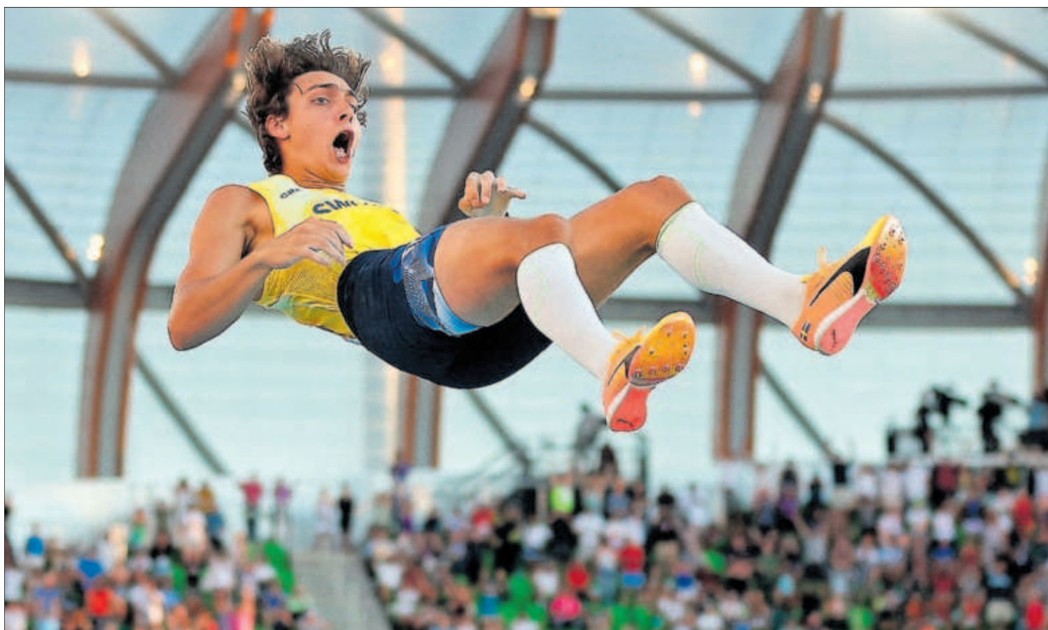
EL RÉCORD DE DUPLANTIS, BROCHE DE ORO DEL MUNDIAL. El atleta sueco, de 22 años, saltó 6,21 metros con la pértiga, la mejor marca de la historia, y abrumó a sus rivales en la jornada final del Mundial de Atletismo de Oregón (EE UU). PÁGINA 28

La derecha política, judicial y mediática no cesa en su ofensiva contra el nuevo fiscal general del Estado, Álvaro García Ortiz, pese a que no tiene el pasado político de la dimitida Dolores Delgado. Los ataques combinan críticas a su trayectoria con falsedades sobre su relación con ETA y con un banquero andorrano, o sobre su papel en el caso Prestige . PÁGINA 18