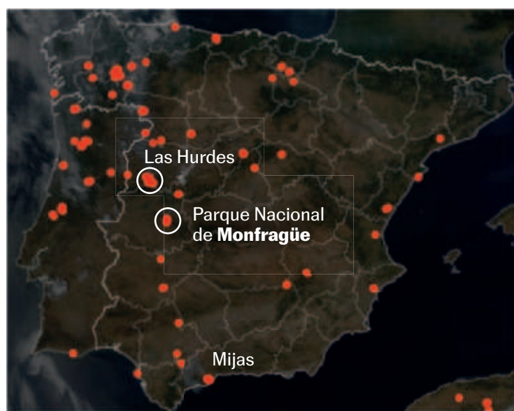
Focos activos de calor de las últimas 24 horas captados por el sensor Modis de la NASA.

La ola de calor impulsa los incendios en toda la península Ibérica y Baleares, que se mantienen en situación de riesgo extremo. Protección Civil se enfrenta a 33 incendios en España, de los cuales 14 seguían activos anoche, 15 se daban por controlados y 4, estabilizados. Dos incendios adquieren especial gravedad: el de Las Hurdes-Monsagro-Ladrillar, que ha afectado por el momento a 2.500 hectáreas en las provincias de Cáceres y Salamanca, y el que afecta al Parque Nacional de Monfragüe, Reserva de la Biosfera, más de mil hectáreas también en la provincia de Cáceres. Además, se han detectado dos grandes focos en Mijas (Málaga) y en