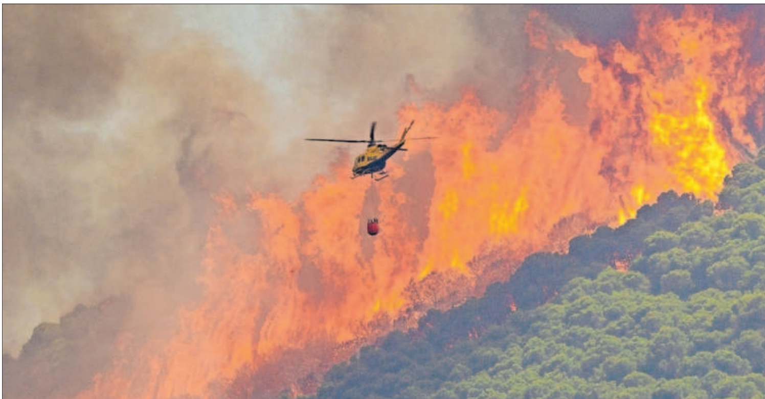
Un helicóptero, ayer en las tareas de extinción del incendio en el paraje El Higuérón de Mijas (Málaga).