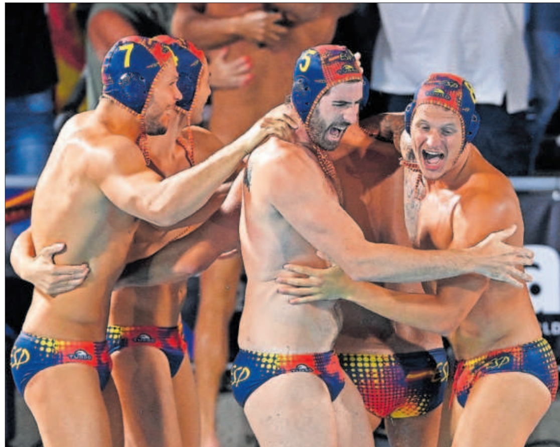
Los jugadores de la selección de waterpolo celebran el triunfo en el Mundial de Budapest.