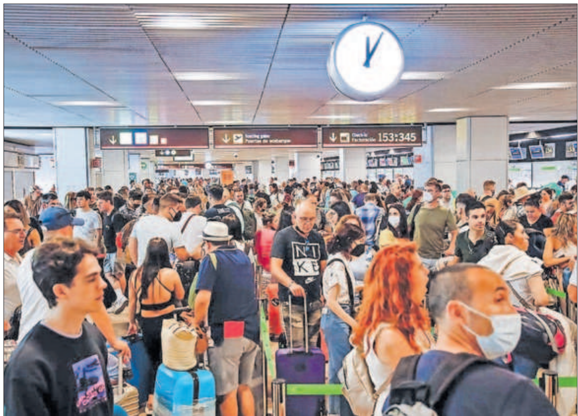
CARLOS LUJÁN (EP)