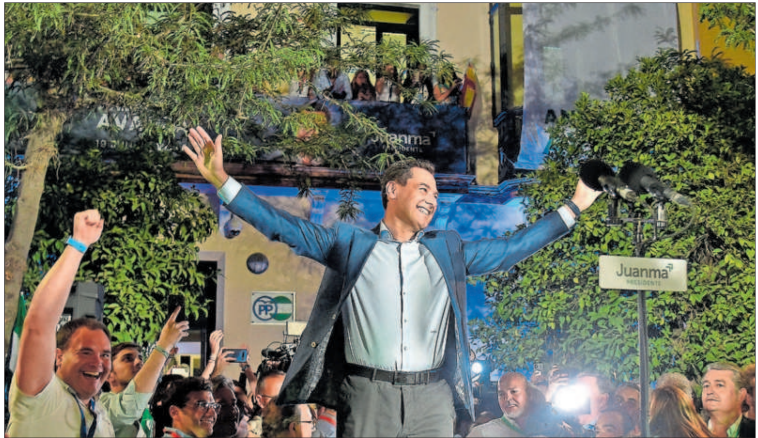
Juan Manuel Moreno celebraba anoche los resultados ante la sede del PP en Sevilla.