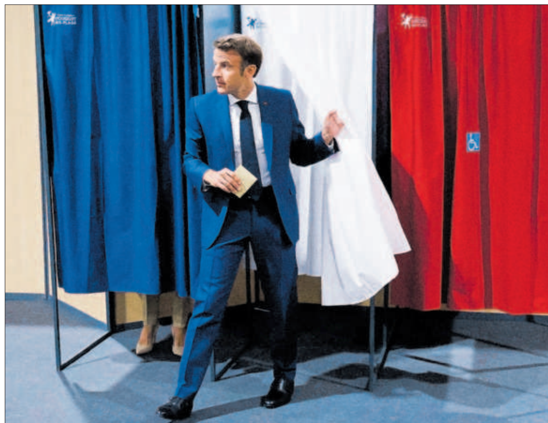
Emmanuel Macron, ayer en el colegio electoral al que acudió a votar en París.

ejecución de los fondos europeos “va a impulsar el crecimiento de la economía”. Y anticipa que las cuentas incorporarán un análisis sobre “el alineamiento con la transición ecológica”. La publicación de este texto, de 26 páginas, implica el inicio de un trámite legislativo que resulta incierto para los que serían los últimos Presupuestos de la legislatura. PÁGINA 41