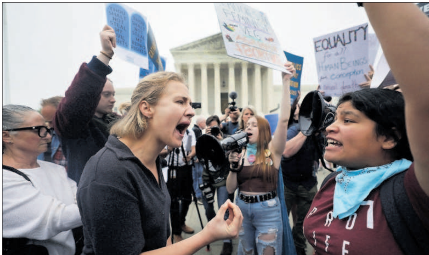
Manifesteros a favor y en contra del derecho al aborto se enfrentaban ayer a las puertas del Supremo en Washington.