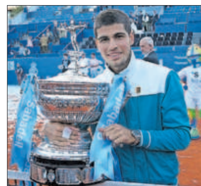
Carlos Alcaraz, ayer.

Alcaraz conquista el Godó, su cuarto título en la élite