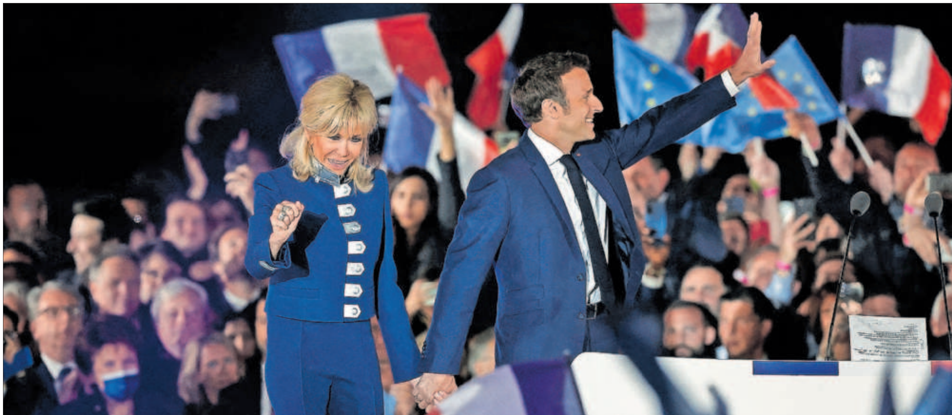
Emmanuel Macron, anoche junto a su esposa Brigitte en su comparecencia en París tras conocerse la victoria electoral de su candidatura.