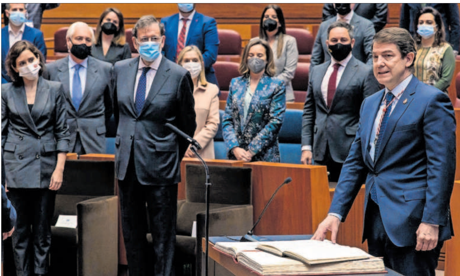
Fernández Mañueco jura su cargo en presencia de Santiago Abascal, Cuca Gamarra, Mariano Rajoy e Isabel Díaz Ayuso, entre otros.