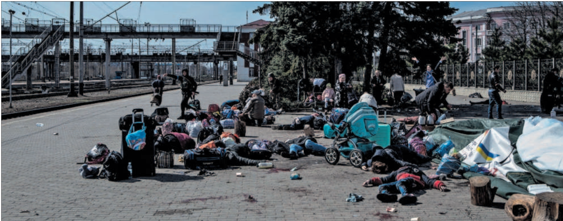
Cadáveres y heridos, en la estación de tren de Kramatorsk después del ataque de ayer con un misil. Junto a ellos, sus pertenencias abandonadas.