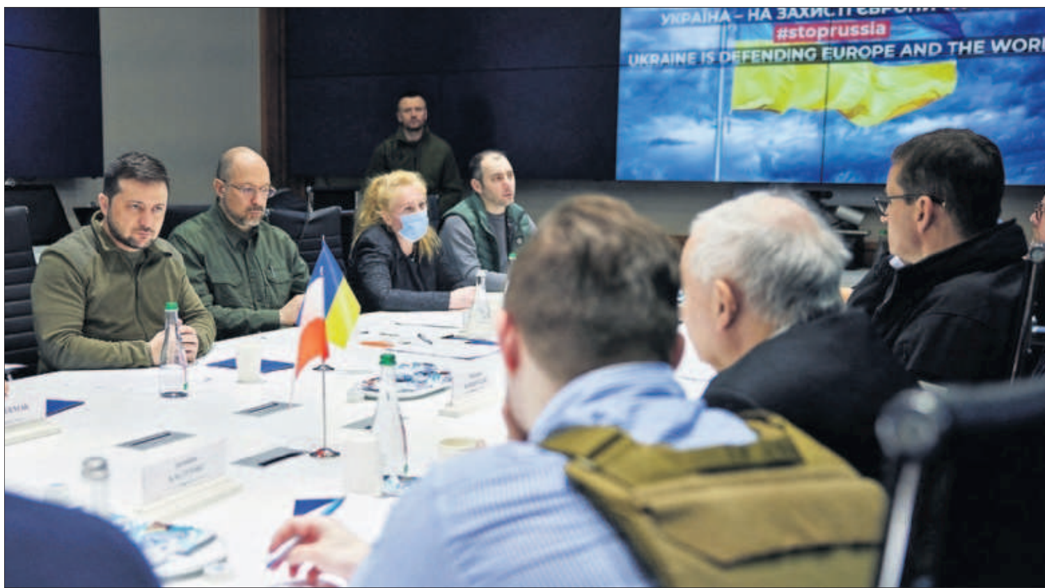
La reunión entre el presidente ucranio, Volodímir Zelenski, y los primeros ministros de Polonia, Jaroslaw Kaczynski; de la República Checa, Petr Fiala; y de Eslovenia, Janez Jansa, entre otros dirigentes de esos países, en una imagen facilitada por la presidencia ucraniana. / REUTERS