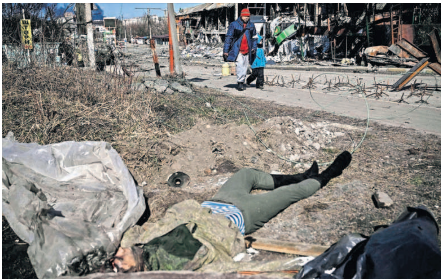
Unos vecinos pasaban ayer junto al cadáver de un soldado ruso durante la evacuación de la ciudad de Irpin, cercana a Kiev.

LLUÍS PELLICER, Madrid El Banco Central Europeo (BCE) decidió ayer acelerar el paso en la retirada de los estímulos que se lanzaron por la pandemia ante la elevada inflación, que tende a cronificarse por los efectos de la guerra en Ucrania. El programa de compra de deuda se irá reduciendo hasta los 20.000 millones mensuales en junio, cuando se prevé que acabe. PÁGINA 39