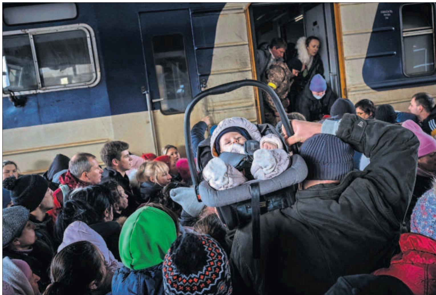
Un hombre levantaba ayer a su bebé entre la multitud que trataba de entrar en un tren en la estación de Kiev para huir de la capital.