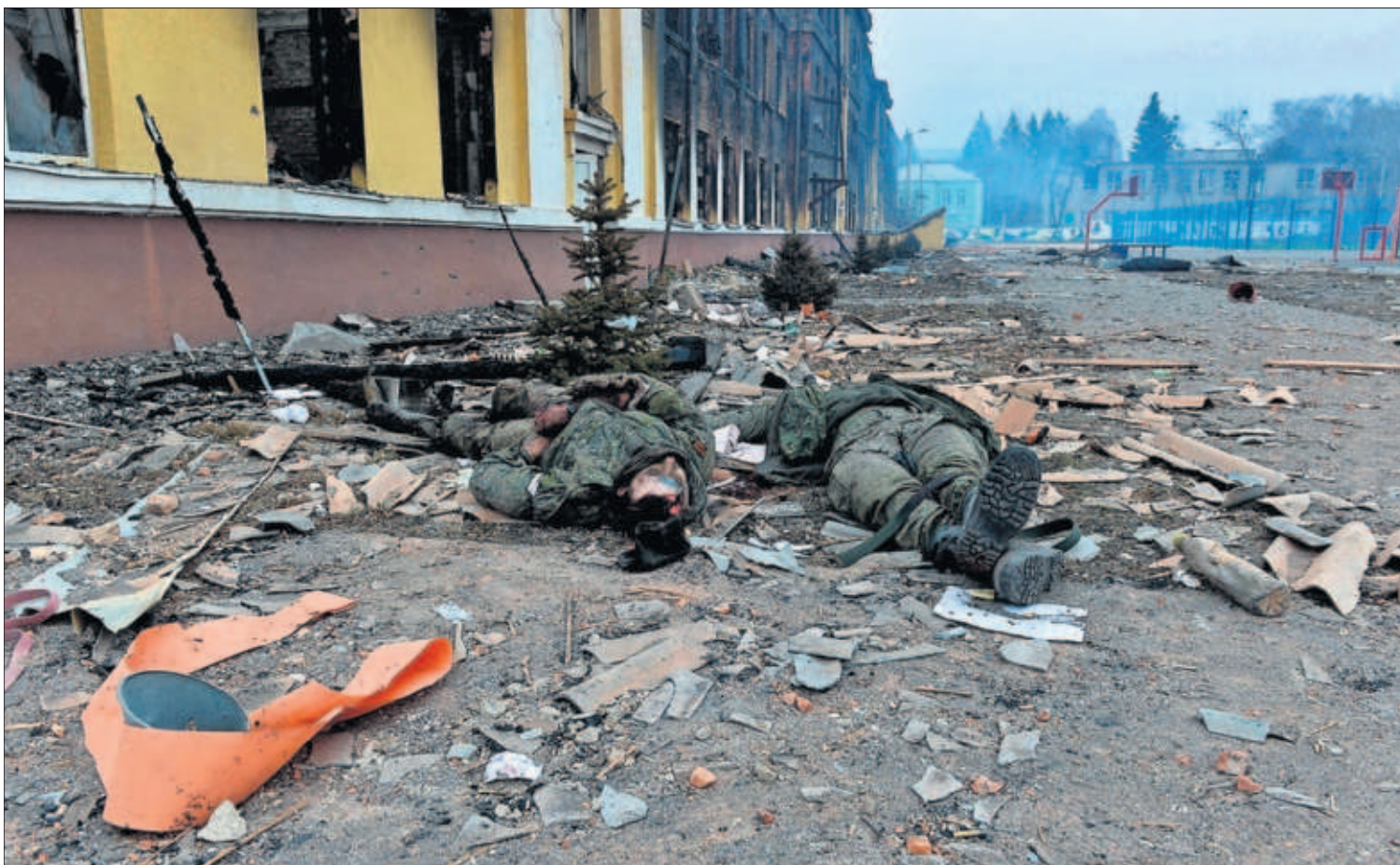
Los cuerpos de dos soldados rusos, ayer junto a una escuela destruida durante los combates en la ciudad de Járkov.