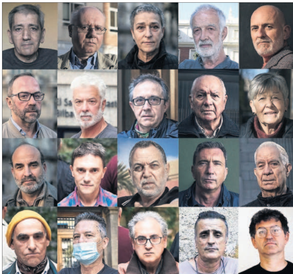
Denunciantes de abusos sexuales en la Iglesia española fotografiados por EL PAÍS desde 2018.

La comisión estará formada por “expertos, representantes de las administraciones públicas, de las asociaciones en defensa de los afectados y de la propia Iglesia católica con el objetivo de contribuir a la determinación de los hechos y responsabilidades, a la reparación de las víctimas y a la planificación de las políticas públicas” para la prevención y atención de estos casos. PÁGINAS 28 A 31