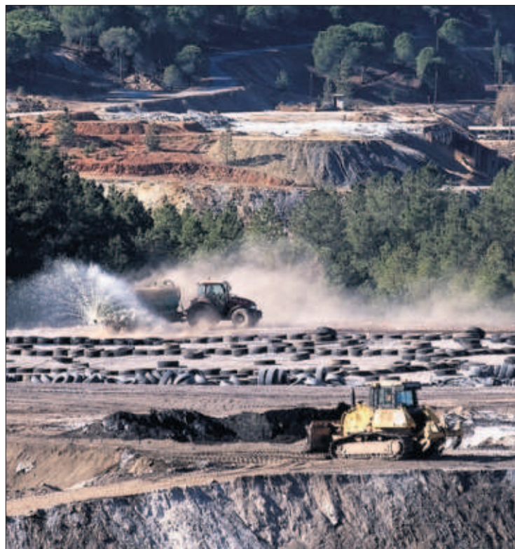
Las instalaciones del vertedero de Nerva (Huelva), ayer.

del cargamento previsto de granilla —un residuo industrial peligroso con volumen arenoso—, tierras y piedras contaminadas. Unos 500 camiones harán las dos primeras entregas en el puerto fluvial de Sevilla y atravesarán carreteras secundarias hasta Nerva. En esta localidad, una inmensa cloaca de 60 hectáreas que asume basura de Montenegro y de otros países como Italia, Grecia o Malta se encuentra a solo 700 metros del pueblo, de 5.300 habitantes. PÁGINA 24