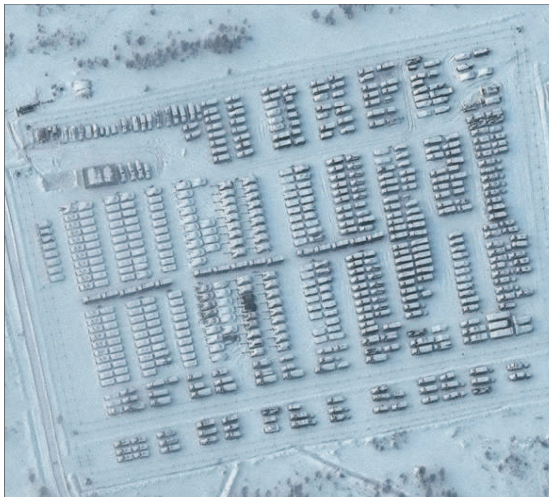
EL DESPLIEGUE RUSO, A VISTA DE SATELITE. La compañía estadounidense Maxar Technologies obtuvo el miércoles las imágenes, conocidas ayer, que prueban la acumulación de fuerzas rusas cerca de sus fronteras con Ucrania y Bielorrusia. En la foto, un gran número de vehículos militares, de transporte y de combate, en el área de Pogonovo, cerca de Voronezh, a unos 250 kilómetros del límite ucranio.

Blinken se verá hoy en Ginebra con su homólogo ruso, Serguéi Lavrov, en una cita decisiva. Washington sancionó ayer a cuatro ucranios (dos diputados y dos funcionarios), a los que acusa de trabajar con Moscú para desestabilizar el país. Entretanto, Rusia anunció el inicio de maniobras militares navales en distintas zonas del mundo, algunas conjuntas con China e Irán. PÁGINAS 2 A 4