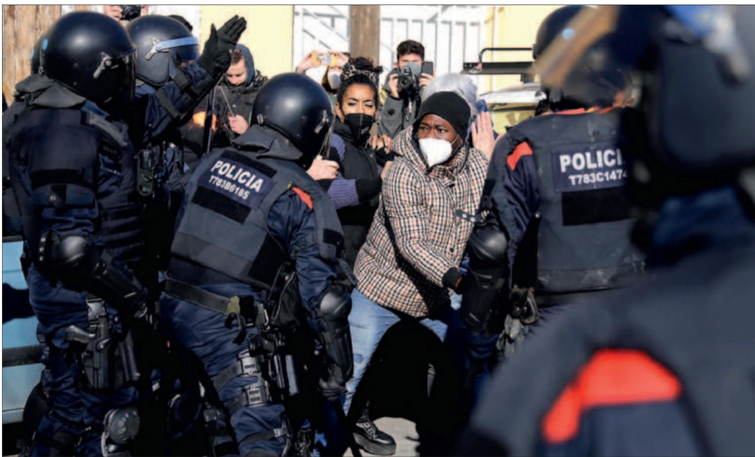
TENSO DESALOJO DE UN CENTENAR DE MIGRANTES DE UNA NAVE EN BADALONA. Un fuerte despliegue de los Mossos expulsó ayer a un centenar de migrantes de una nave, propiedad de la Sareb, en la ciudad catalana. Se vivieron momentos de tensión que llevaron a cargas policiales. La mayoría de los desalojados procedían de otra nave de Badalona que se incendió a fines de 2020. PÁGINA 18

La Comisión de Salud Pública, formada por Sanidad y las autonomías, decidió ayer extender la dosis de refuerzo de la vacuna de la covid a todos los mayores de 18 años. Hasta ahora, la tercera dosis se pinchaba a los mayores de 40 años, por lo que la nueva estrategia afecta a unos 12 millones de personas entre 18 y 39 años. Además, los pacientes inmunodeprimidos recibirán una cuarta dosis. Por otro lado, el Gobierno aprobó que las pruebas de antígenos no podrán costar a partir de mañana más de 2,94 euros. PÁGINA 21