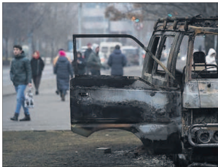
Un vehículo quemado en los disturbios, ayer en Almaty.