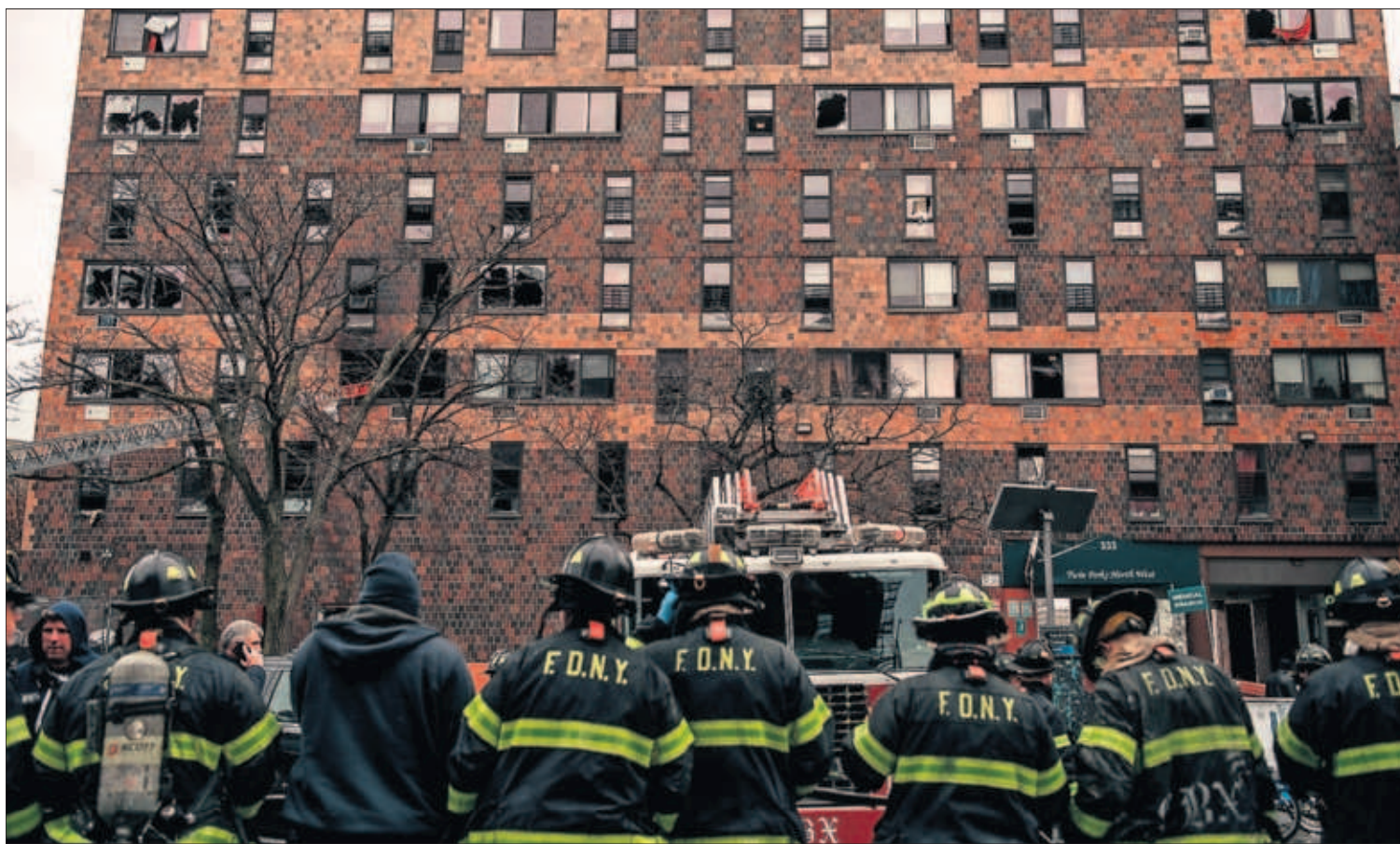
INCENDIO MORTAL EN NUEVA YORK. Al menos 19 personas murieron y más de 60 resultaron heridas en un incendio que se desató ayer en un edificio de 19 plantas en el distrito del Bronx, en Nueva York. El fuego se originó, según las primeras investigaciones, por una estufa eléctrica en una vivienda dúplex situada en la planta segunda y tercera. En la imagen, los bomberos, frente al edificio afectado. PÁGINA 4