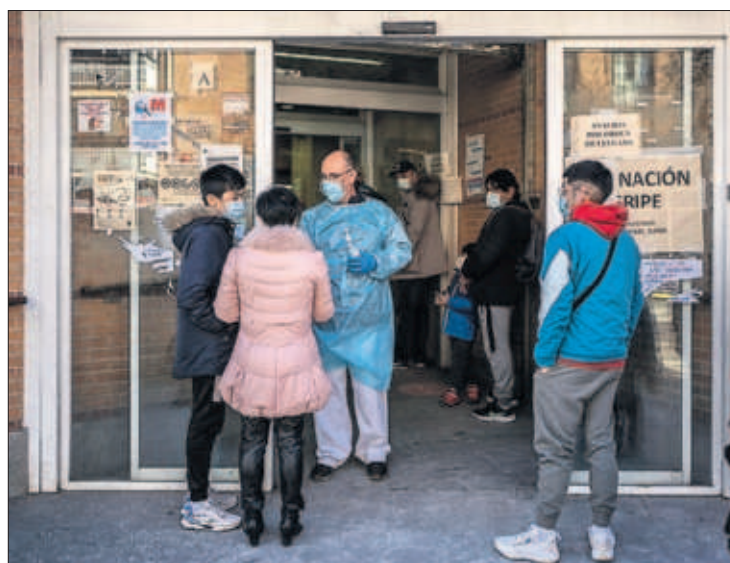
Un sanitario habla con pacientes en un ambulatorio de Madrid.

Cierre de medios y detenciones bajo la dura ley de seguridad de Pekín