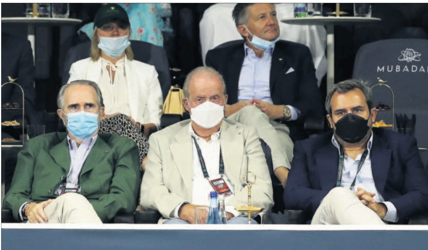
JUAN CARLOS I SE DEJA VER EN UN PARTIDO DE NADAL EN ABU DABI. El rey emérito apareció ayer públicamente después de meses de perfil bajo al asistir, en un palco con otras nueve personas, al partido entre Rafael Nadal y Andy Murray del Mubadala World Tennis Championship, que se celebra en el emirato donde reside desde su salida de España en agosto de 2020. PÁGINAS 15 Y 38

ELENA G. SEVILLANO, Berlín El legado de Angela Merkel empieza a desdibujarse apenas unas semanas después de su salida del poder. Friedrich Merz, de 66 años, un político liberal en lo económico y conservador en lo social, presidirá la Unión Cristiana-demócrata (CDU), al lograr el 62% del voto de los afiliados. El partido vira así a la derecha tras el período centrista que dominó la canciller durante dos décadas. PÁGINA 2