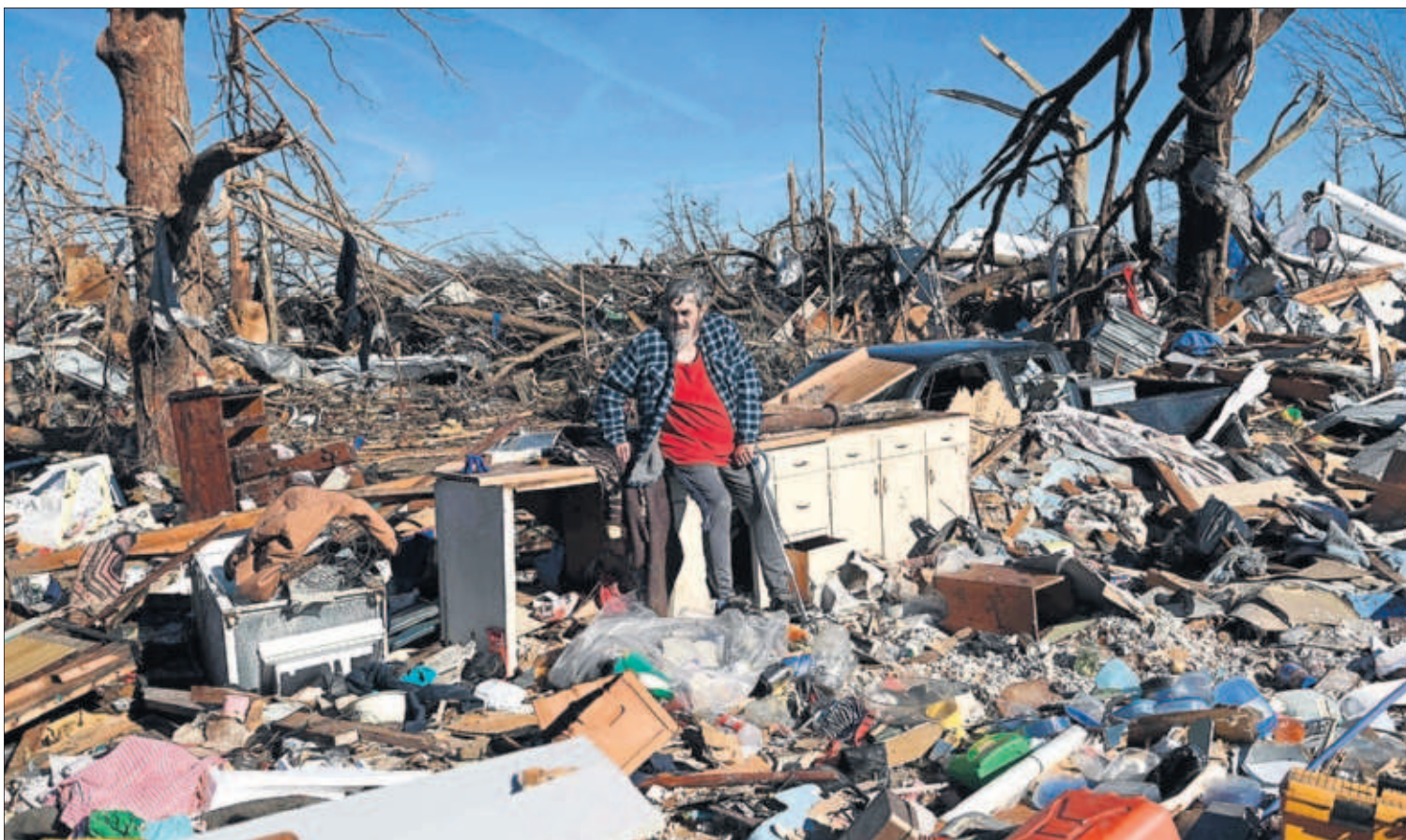
Un hombre examina los restos de su casa, reducida a escombros por el paso de un huracán en Mayfield, Kentucky (EE UU).

Pueblos arrasados y decenas de muertos tras una inaudita catástrofe en EE UU