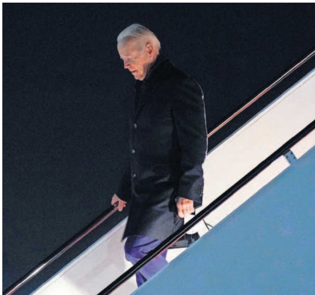
TROPIEZO DE BIDEN EN LAS URNAS. La derrota del candidato demócrata a gobernador de Virginia supone un revés para el presidente de EE UU al cumplirse un año de su victoria ante Trump. En la imagen, Biden desembarca a su regreso a Washington de la cumbre de Glasgow. PÁGINAS 4 Y 5

La CEOE había expresado su rechazo a establecer un límite igual a todos los sectores. Ciertas actividades, como la agricultura o el turismo, tienen una proporción de eventuales muy alta por su estacionalidad. Otra idea sobre la mesa es canalizar el empleo eventual a través de las empresas de trabajo temporal, que convertirían así en fijos discontinuos a unos 300.000 empleados. También se plantea que unos 800.000 trabajadores de la construcción con contratos de obra se equiparen a los indefinidos. PÁGINA 46