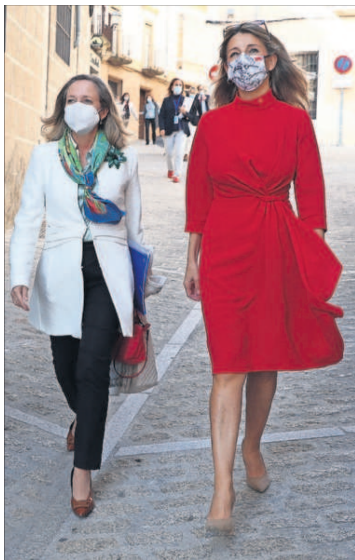
LA FOTO DE LA TREGUA. Las vicepresidentas Nadia Calviño y Yolanda Díaz, que han protagonizado en los últimos días un pulso en torno al control de la reforma laboral, coincidieron ayer en la cumbre hispanoportuguesa, presidida por Pedro Sánchez y António Costa en Trujillo (Cáceres), y caminaron juntas por sus calles. PÁGINA 20