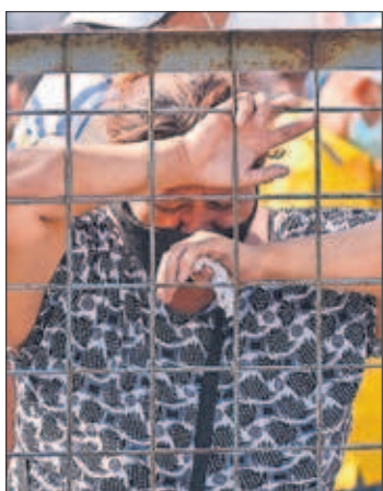
Una mujer llora tras la matanza.

SARA ESPAÑA, Guayaquil El motín iniciado el martes en la cárcel del Litoral, en Guayaquil, terminó con 116 muertos y 80 heridos. La tragedia exhibe la debilidad del Estado en Ecuador frente a las bandas criminales. PÁGINA 6