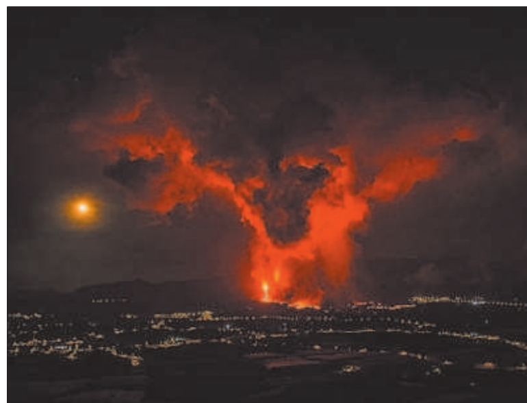
Erupciones en el volcán de Cumbre Vieja, ayer en La Palma.

El geólogo que avisó de que el volcán iba a despertar P32