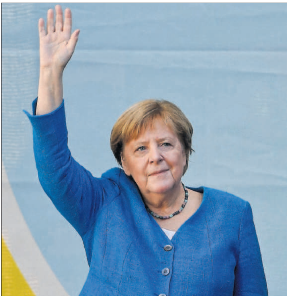
La canciller Angela Merkel, en un acto de campaña de Armin Laschet ayer en Aquisgrán (Alemania).

Scholz, un candidato eficaz sin estridencias P5