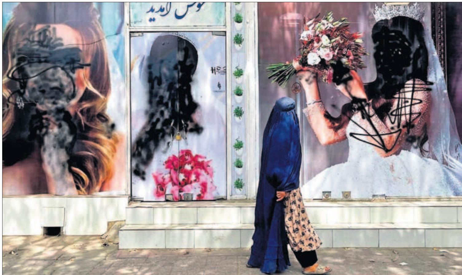
Una mujer pasea frente a un salón de belleza de Kabul donde los anuncios con imágenes de mujeres han sido borrados.