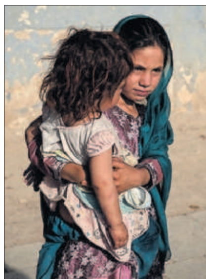
Dos niñas en Kandahar. / JUAN CARLOS

suelo para celebrar su victoria. Uno de ellos desgajó la bandera afgana de un coche de la policía y la arrojó al suelo. “Afganistán es ya del islam”, decía. La población, reclusa durante dos días, comenzó a salir tímidamente de sus casas, sin saber, en especial las mujeres, qué iba a ser de ellos. PÁGINAS 4 Y 5