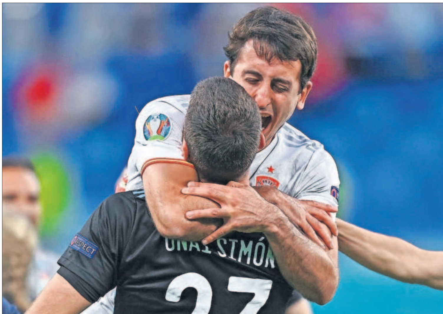
Oyarzabal se abraza con Unai Simón después de marcar el último penalti que clasifica a España para semifinales.