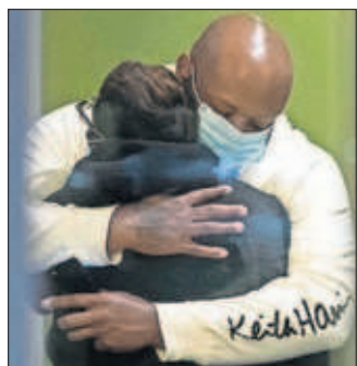
Dos personas se abrazan tras el tiroteo en Indianápolis.

mia queden fuera del debate político, que apliquen criterios científicos sobre las vacunaciones y que eviten usar como ariete entre sí los mensajes públicos sobre sanidad. También solicitan que las autoridades coordinen sus actuaciones y sus mensajes, y que lo hagan de una manera rápida. Estas decisiones, añade el manifiesto, deberían ser comunicadas con transparencia a la población. Otro de los puntos precisa que son los científicos los que deben traducir el conocimiento en recomendaciones sanitarias. PÁGINA 21