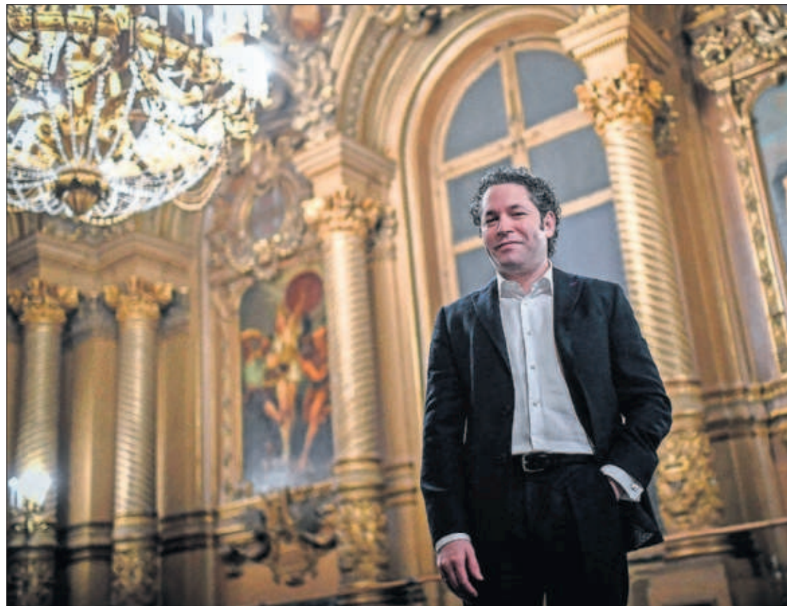
El director de orquesta venezolano Gustavo Dudamel, ayer en la Ópera de París.

tas extranjeros como viajeros nacionales—, excluyendo a transportistas y a particulares que usan la carretera para ir al trabajo. El Ministerio de Transportes plantea esta idea a medio plazo. No es una novedad. El Gobierno ya había insinuado una iniciativa así en alguna ocasión, pero es la primera vez que la plasma en un documento oficial. PÁGINA 39