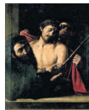
La obra en discusión.

ÁLVARO SÁNCHEZ, Madrid Los nuevos cálculos del Gobierno sobre la recuperación menos vigorosa. La vicepresidenta Nadia Calviño rebajó ayer la previsión de crecimiento del PIB para este año al 6,5%, tres puntos menos que la estimación de hace seis meses, por el mal arranque del año y el retraso de los fondos de la UE. Estas perspectivas comprometen los Presupuestos para este año. Las previsiones de ingresos quedan desfasadas y los gastos por ERTE y ayudas a empresas serán insuficientes. PÁGINA 38