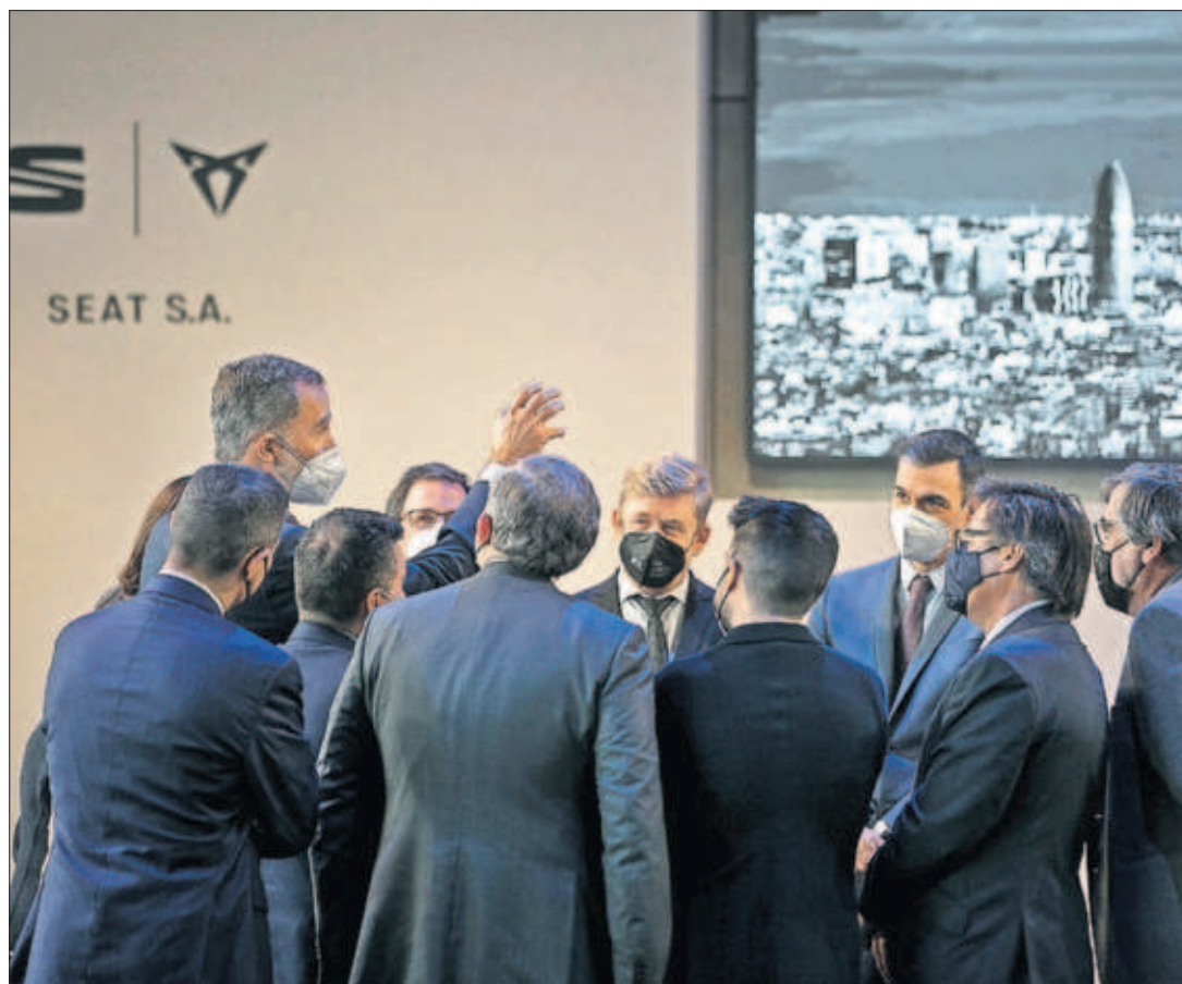
EL GOBIERNO ARROPA A FELIPE VI. La visita de ayer del Rey con el presidente del Gobierno a la planta de Seat en Martorell (Barcelona) supuso un acto de apoyo de Pedro Sánchez a Felipe VI en una de las semanas más duras de su reinado. La Generalitat dio plantón al Ejecutivo y a la Corona. P14