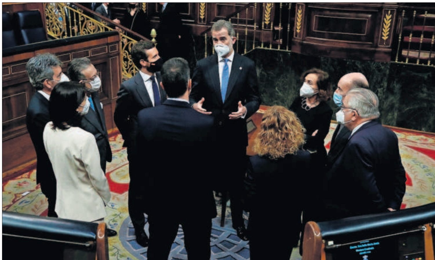
El Rey (en el centro) conversaba ayer en el Congreso con Carmen Calvo, Miquel Roca, Juan José González Rivas, Meritxell Batet, Pedro Sánchez, Pilar Llop, Carlos Lesmes, Miguel Herrero y Rodríguez de Miñón y Pablo Casado (en el sentido de las agujas del reloj).

Rey y reivindicaron la república. ERC, Junts, PDeCAT, Bildu, BNG y CUP acordaron una declaración según la cual el 23-F fue “una operación de Estado para salvar al régimen del 78”. PÁGINAS 14 Y 15