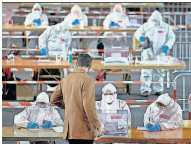
Votación en un polideportivo de Girona, con los miembros de las mesas enfundados en equipos de protección.