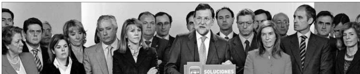
Mariano Rajoy, rodeado del Comité Ejecutivo del PP, en una comparecencia de febrero de 2009 sobre corrupción.

ORIOU PUIGDEMONT, Brisbane El lunes arrancará el Abierto de Australia de tenis con público en las gradas. Una imagen impensable en cualquier otro lugar. El país, con 25,5 millones de habitantes, tiene solo 52 casos activos de covid. 909 muertos en total. Un éxito basado en un estricto cierre de fronteras, multas y una población que tiende a cumplir las normas. PÁGINA 28