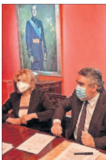
La baronesa Thyssen y el ministro Uribes firmando el acuerdo, ayer.

ción se quede en España hasta 2036 por 6,5 millones de euros anuales. "Estoy muy contenta de haber evitado que salga del país", declaró Carmen Cervera. "Tras años de incertidumbre, llega cierta estabilidad", defendió el ministro Rodríguez Uribes. PÁGINA 27