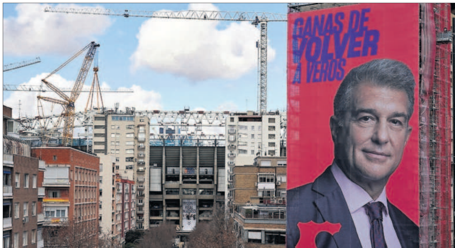
JOAN LAPORTA HACE CAMPAÑA POR EL BARÇA JUNTO AL BERNABÉU. El candidato a la presidencia del FC Barcelona se anuncia en una enorme lona cerca del estadio del Real Madrid, el eterno rival, con el lema "Ganas de volver a veros". PÁGINA 34

Juan Guaidó defiende, en una entrevista con EL PAÍS, la continuidad de la Asamblea Nacional de Venezuela y su reconocimiento como presidente encargado como "la defensa de lo que queda de democracia" en el país. PÁGINA 4