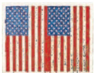
J. JOHNS (VEGAP)

Escritores, músicos y artistas protagonizan un momento de esplendor creativo y reclaman un cambio en la Casa Blanca