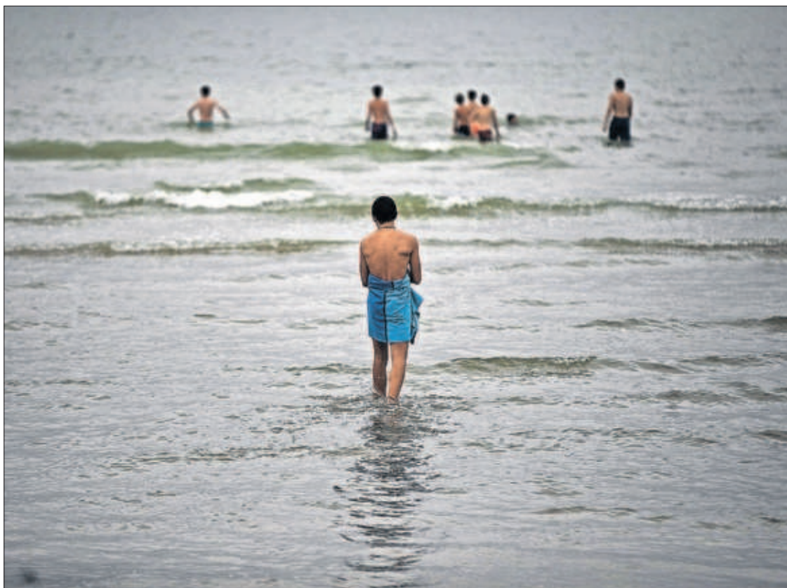
La playa de Ostende, en un día lluvioso de mediados de julio.